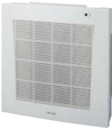
XLS 7/9/12 RC