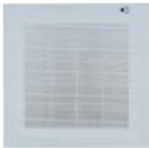
Couleur Façade : Grey (Pantone 427)

En fonction du type de décoration intérieure, il est possible de personnaliser le Louisiana XLS avec des façades de couleur disponibles en accessoire.