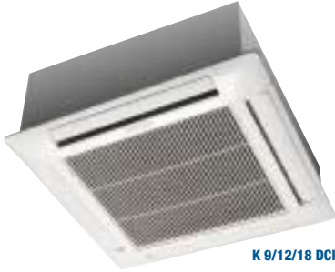
K 9/12/18 DCI