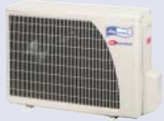
GC NG 9/12/18 DCI

La structure en matériau polyester thermostable permet la réduction des niveaux sonores, du poids et allongement de la durée de vie. Le traitement anticorrosion avec revêtement peinture poudre High density assure une haute résistance quelles que soient les conditions de fonctionnement.